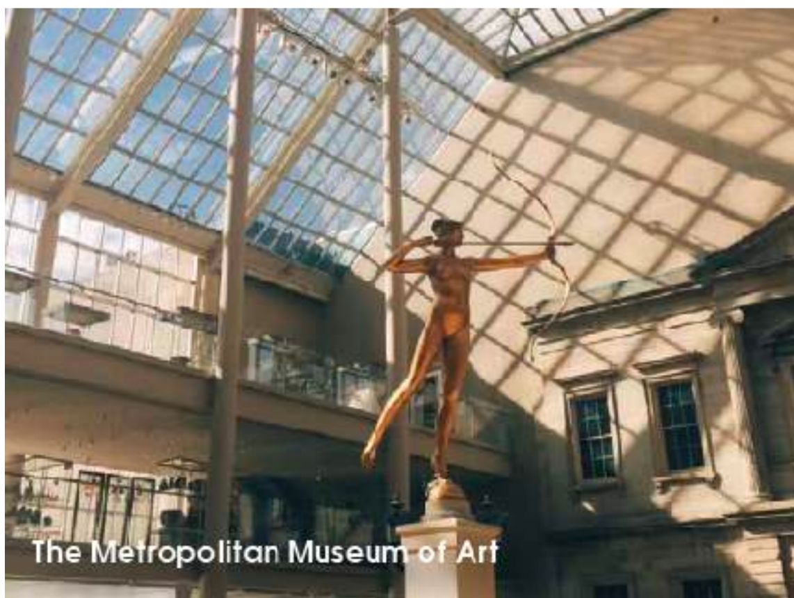
The Metropolitan Museum of Art